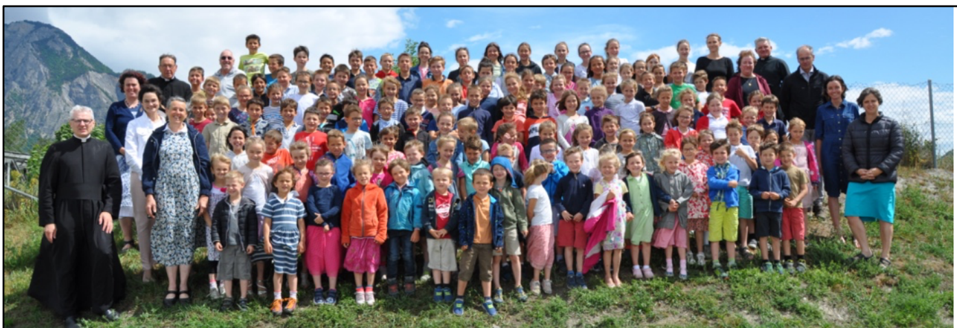
École Fleurs de Mai – année scolaire 2021-2022