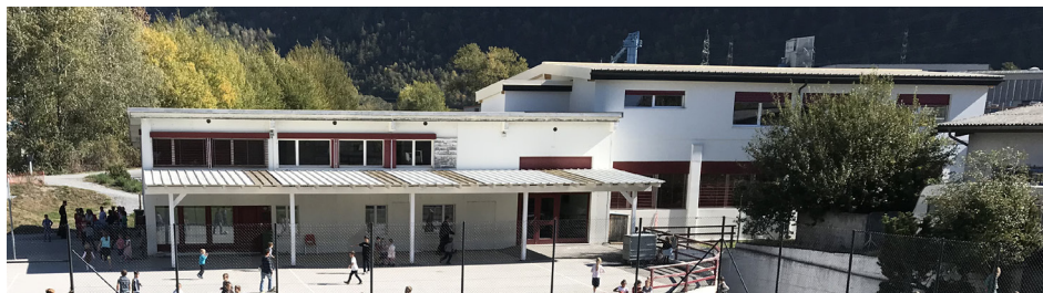
Ci-dessus, la partie gauche du bâtiment, toit et façade, sont à rénover